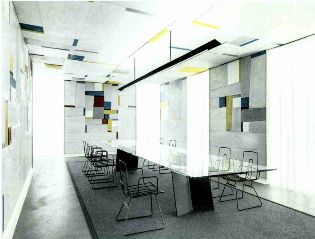
Alfredo Häberli stattet Fritz Glarners Rockefeller Room mit leichten Stühlen, einem schwebenden Glastisch und einer Leuchte aus. Ein grauer Teppich bindet die Intervention zusammen, die den Blick auf Glarners Werk freilässt.

Themen-Nr.: 800.008 Abo-Nr.: 800008 Seite: 60 Fläche: 58'914 mm 2