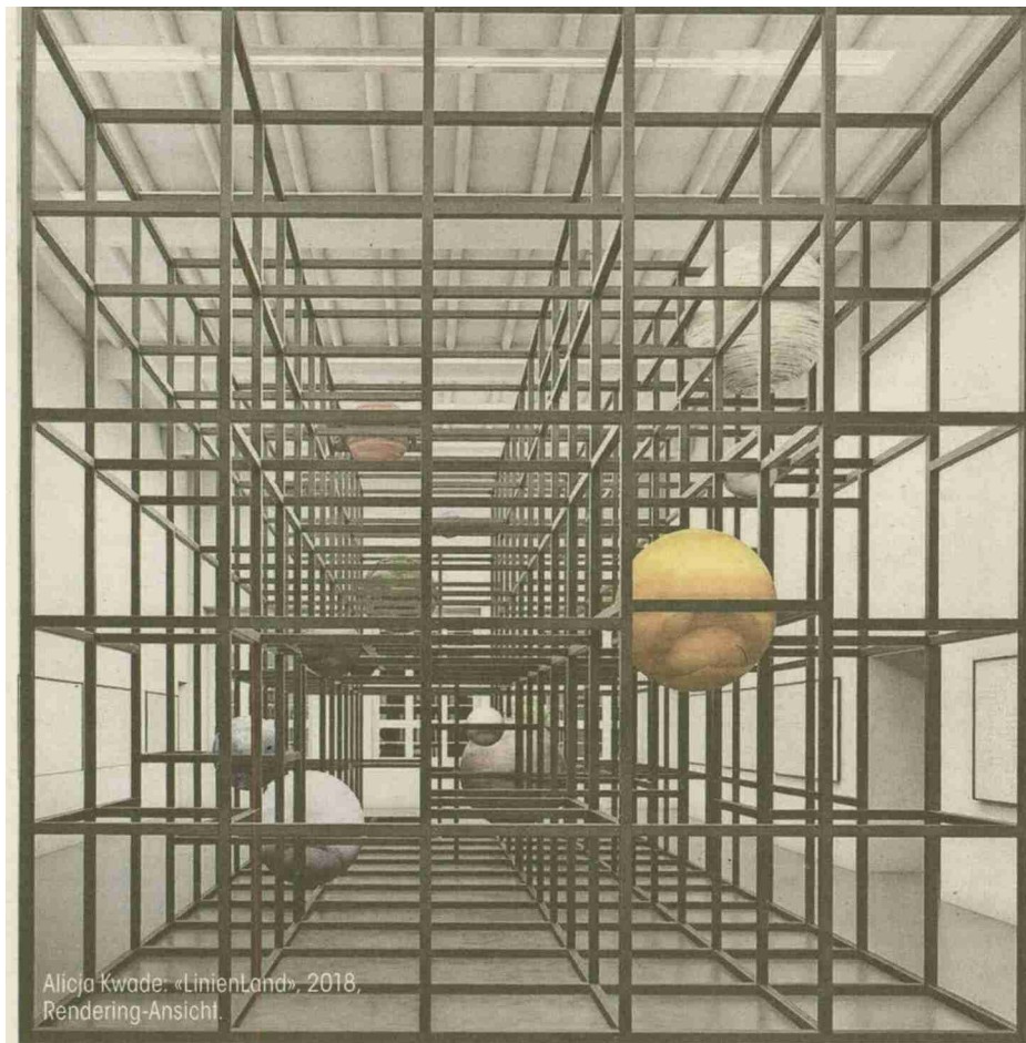
Alicja Kwade: «LinienLand», 2018, Rendering-Ansicht.