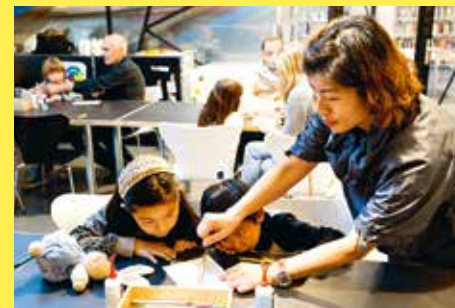
Familienworkshop im Museum Haus Konstruktiv.

Teilnehmerzahl beschränkt. Anmeldung erforderlich unter: l.gerber@hauskonstruktiv.ch Kosten pro Familie: CHF 30