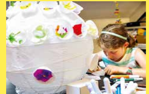
Kinderworkshop im Museum Haus Konstruktiv.

Teilnehmerzahl beschränkt. Anmeldung erforderlich unter: l.gerber@hauskonstruktiv.ch