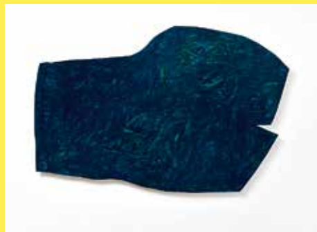
Imi Knoebel, Figura B , 2018 © 2018, ProLitteris, Zürich; IMI KNOEBEL.

Rundgang durch die Ausstellung Imi Knoebel – Guten Morgen, weisses Kätzchen . Anschliessend Präsentation des im Hatje Cantz Verlag erschienenen Kataloges – mit Texten (d/e) von Sabine Schaschl, Max Wechsler und Beat Wismer