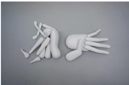
Yves Netzhammer Versuchsanordnung, 2022 © Yves Netzhammer 2022