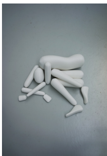
Yves Netzhammer Versuchsanordnung, 2022 © Yves Netzhammer 2022